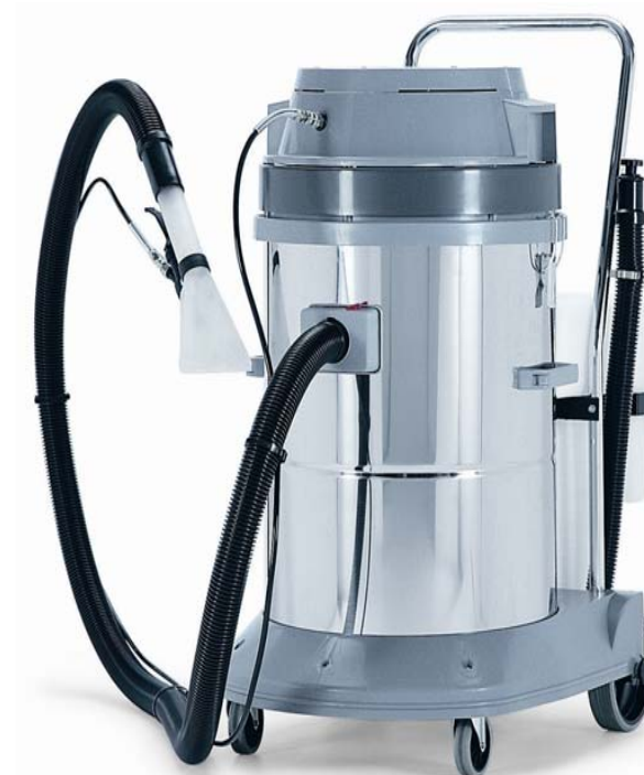
Extract A58.3 DP - Extract A58.3

* Si possono connettere utensili elettrici o pneumatici - Electrical or pneumatic tools can be connected