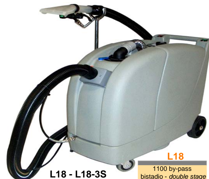
L18 - L18-3S

Professional injection/extraction machines: they are used to clean all kind of surfaces such as carpets and moquette. They are an excellent combination of cleaning pressure and dryer with small overall dimensions. Model L18-3S, equipped with a tri-stage motor, is extremely powerful for heavy operations.