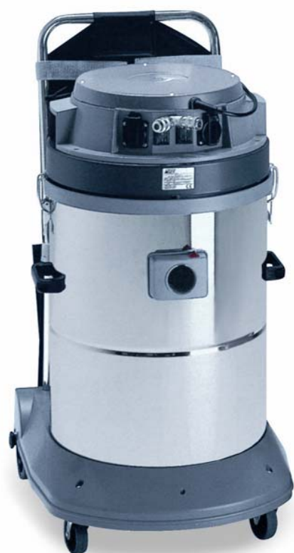
Remote A58.3 *

Aspirapolveri a controllo remoto permettono di utilizzare utensili elettrici e pneumatici con l'aiuto di un'efficace aspirazione. L'accensione dell'utensile determina automaticamente l'accensione dell'aspirapolvere, mentre quando l'utensile viene spento l'aspirapolvere rimane in funzione ancora per dieci secondi.