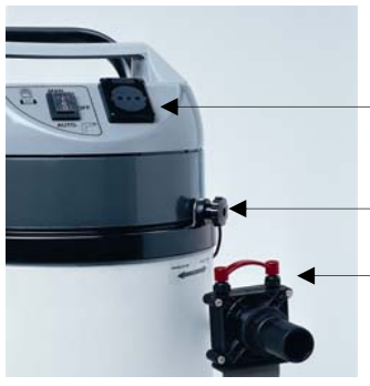
Presca elettrica per utensili di controllo remoto dell'accensione dell'aspiratore. Socket for tools with a remote control ignition.